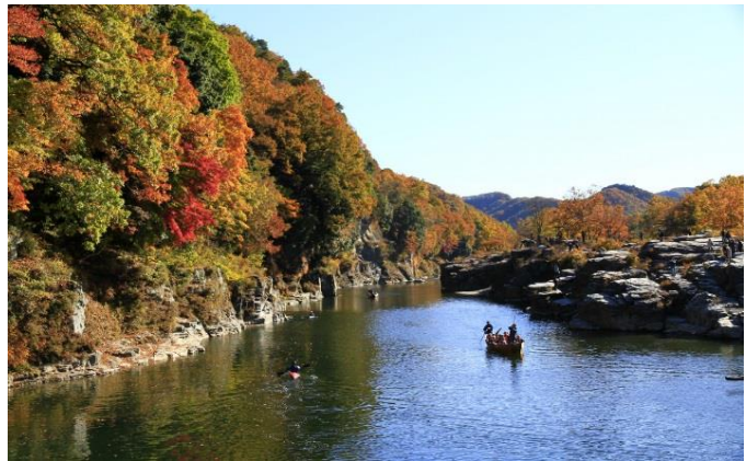
長瀨岩畳 (イメージ)