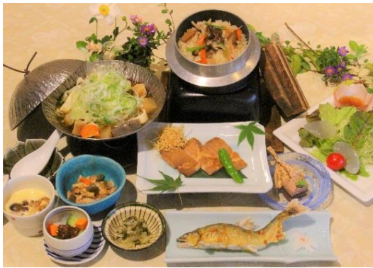
長生館ご昼食 (イメージ)