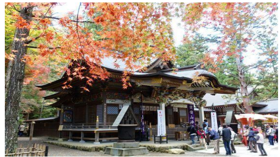
寶登山神社 (イメージ)