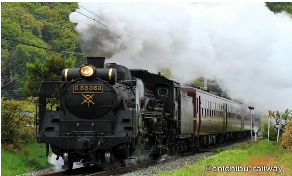
SLパレオエクスプレス(イメージ)