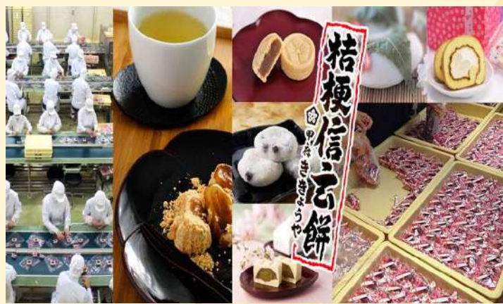
★人気の「 桔梗信玄餅工場テーマパーク 」