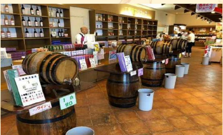
★甲州ワイン「 シャトー勝沼での試飲とお買い物 」