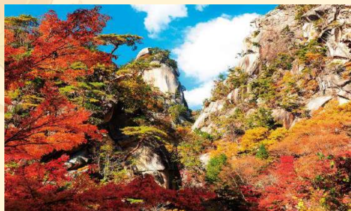
★紅葉の名勝「 昇仙峡散策 」