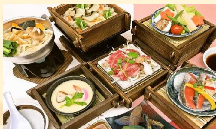
★昼食「 FUJIフルーツパーク 」